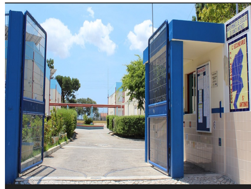
ESCOLA BÁSICA E SECUNDÁRIA DE SANTO ANTÓNIO