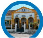
EB Stº António