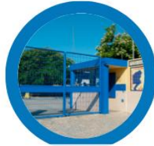
Básica e Secundária de Santo António (Escola Sede)