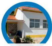
JI Fonte Feto

Construir pontes: promovendo a aprendizagem, a diversidade e a inclusão