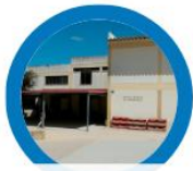
EB Cidade Sol