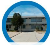
EB Vila Chã